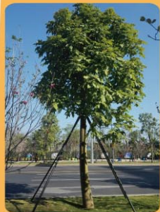
澳洲火焰木 Brachychiton acerifolius 開花喬木。 Árvore florida.

Espécies arbóreas resistentes ao vento recomendadas