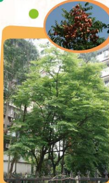
複羽葉欒樹 Koelreuteria bipinnata 開花喬木，遮蔭效果好。 Árvore florida e com boa sombra.