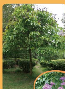
大花紫薇 Lagerstroemia speciosa 開花喬木，遮蔭效果好。 Árvore florida e com boa sombra.