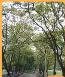
麻楝 Chukrasia tabularis 常綠喬木。 Árvore de folha perene.

Geralmente, designam-se espécies arbóreas capazes de resistirem ao vento como aquelas cujo tronco é forte, cujo sistema radicular que cresce em profundidade fixa bem as árvores ao solo, ou cuja copa é pouco densa, com ramos facilmente quebráveis.