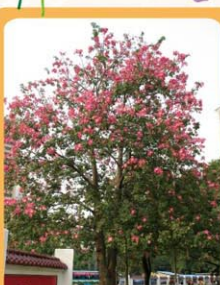
美麗異木棉 Ceiba speciosa 開花喬木。 Árvore florida.