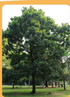
海南紅豆 Ormosia pinnata 常綠喬木，遮蔭效果好。 Árvore de folha perene e com boa sombra.