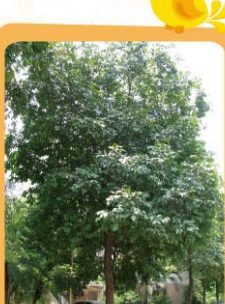
海南蒲桃 Syzygium cumini 常綠喬木，遮蔭效果好。 Árvore de folha perene e com boa sombra.