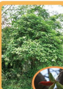
假蘋婆 Sterculia lanceolata 落葉喬木，遮蔭效果好。 Árvore caducifólia e com boa sombra.