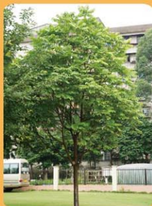
人面子 Dioscorea superreana 常綠喬木，遮蔭效果好。 Árvore de folha perene e com boa sombra.