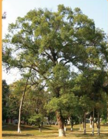
樟樹 Cinnamomum camphora 常綠喬木，遮蔭效果好。 Árvore de folha perene e com boa sombra.