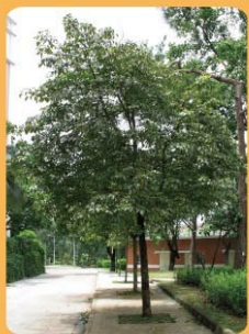
秋楓 Bischofia javanica 常綠喬木，遮蔭效果好。 Árvore de folha perene e com boa sombra.