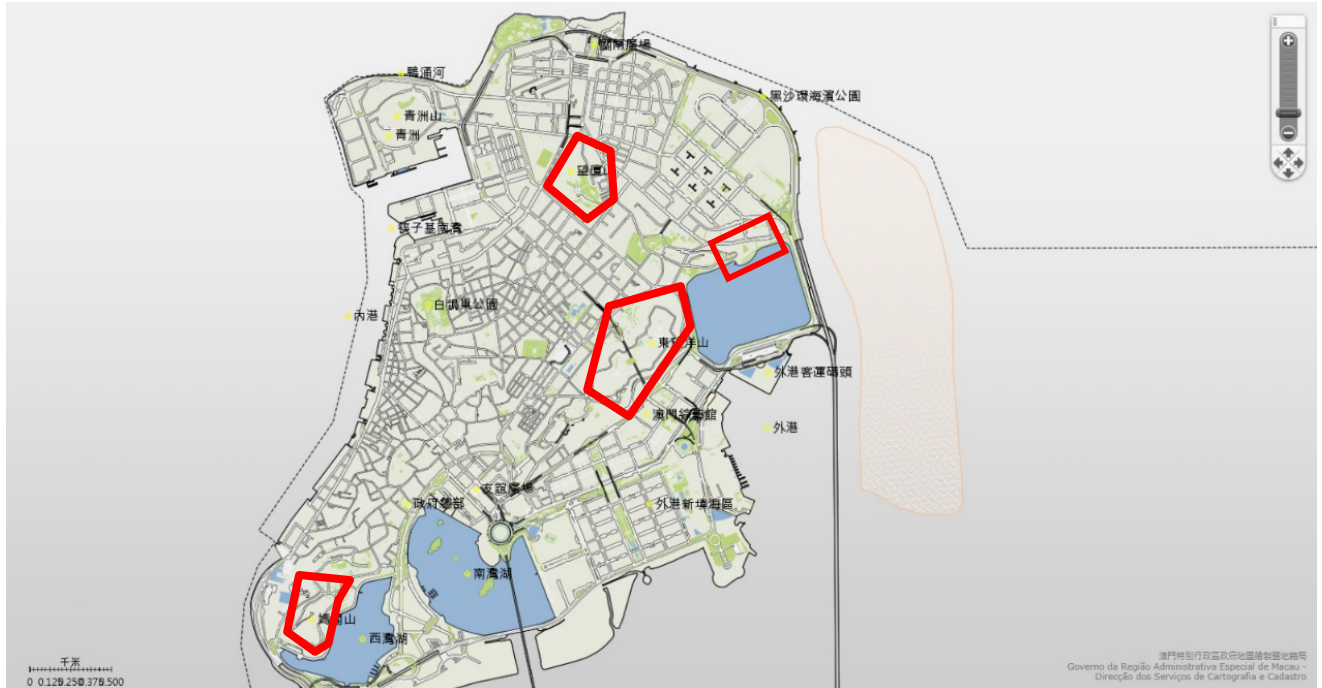
圖一.媽閣山、西望洋山、望廈山、東望洋山和馬交石炮台馬路周邊山坡